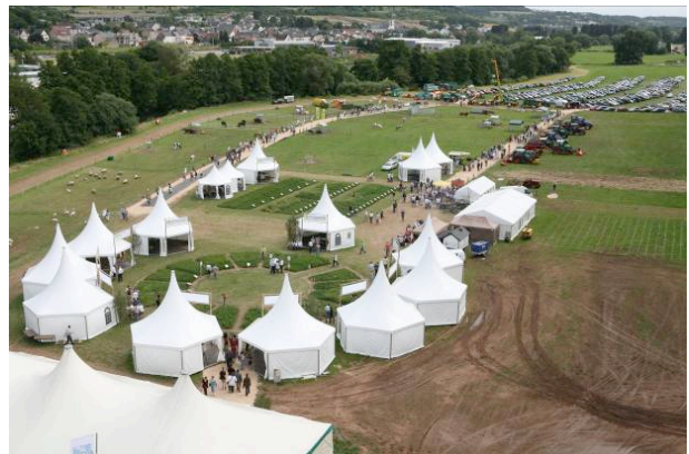
Internationale Grünlandtage 2008 in Ettelbruck

65 Wissenschaftler und Berater aus 17 Organisationen informieren diesjährig während der Landwirtschaftlichen Ausstellung in Ettelbrück die Landwirte, Berater der Landwirtschaft sowie das breite Publikum über vielfältige Themen der Grünlandbewirtschaftung. Außerdem bietet dieses Ereignis allen Beteiligten die Möglichkeit, sich über ihre aktuellen Arbeiten auszutauschen und neue Erkenntnisse zu gewinnen.